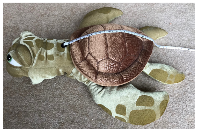
Las tortugas marinas se miden con una cinta flexible a través de la curva del caparazón: Largo curvo del caparazón, LCC