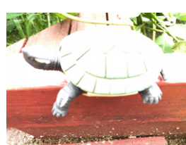
Subexposición o sobreexposición de la imagen

Posibles soluciones: busque e incluya una cinta medidora o regla.