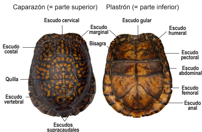
Diagrama de los nombres de las partes del caparazón de una tortuga: