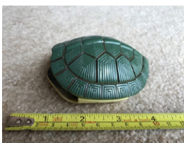
La tortuga no muestra la cabeza o las patas

Posibles soluciones: Espere y sea paciente; acaricie suavemente la parte trasera del animal.