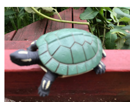
La tortuga está fuera de foco

Posibles soluciones: Espere y sea paciente; acaricie suavemente la parte trasera del animal.