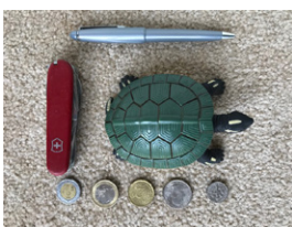
Objetos inusuales usados como calibrador

Posibles soluciones: En la pantalla de un smartphone, apunte a la parte de la imagen que desea enfocar; use el aro de enfoque de una cámara normal; aumente la distancia entre la tortuga y la cámara.