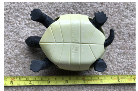
Vista del plastrón (parte inferior del caparazón)