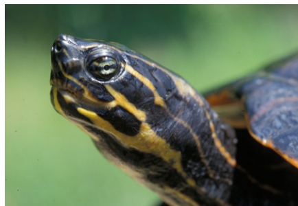
Primer plano de la cabeza