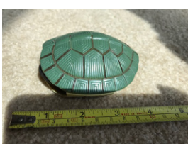
Reflejos o sombras que distraen

Posibles soluciones: Use el flash de la cámara; apunte a una parte de la imagen que desee que el teléfono use para determinar la configuración de exposición; use un fondo diferente.