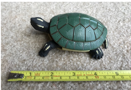
Vista del animal entero, más o menos de lado lateral

Para la gran mayoría de las especies de tortugas terrestres y de agua dulce, 3 fotografías de buena calidad son suficientes para la identificación fiable: